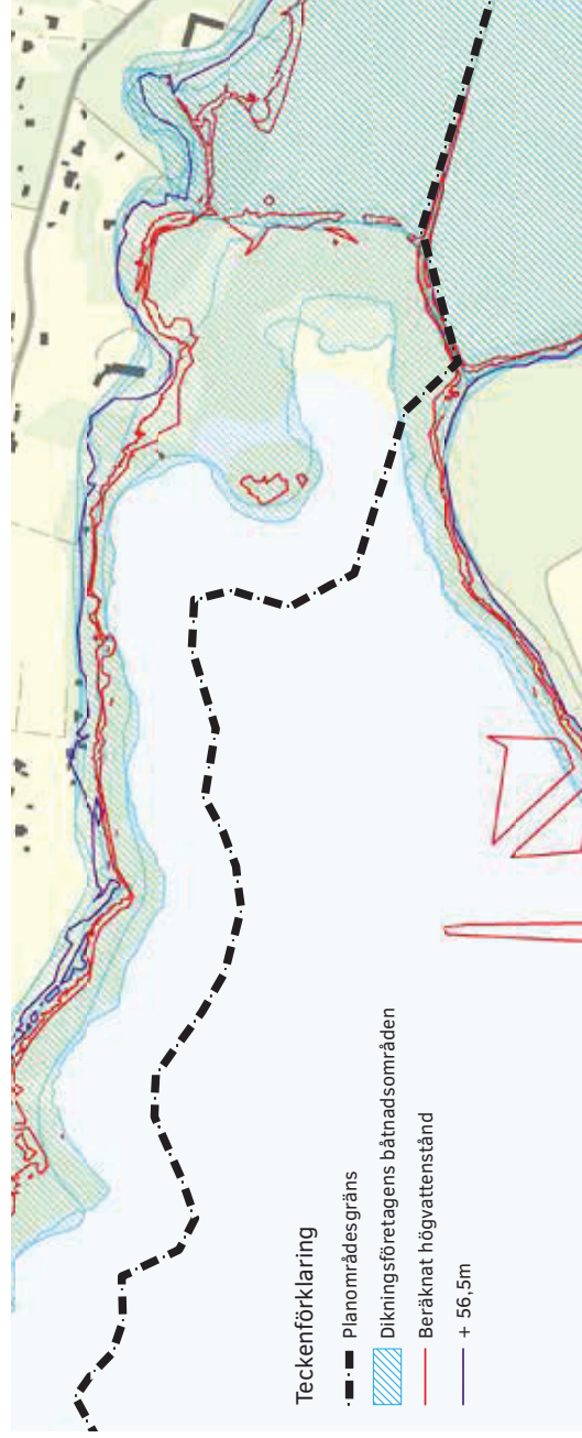
Figur 56. Riskområden för översvämming vid Hasselstigen, Almdalen och Blommeröd