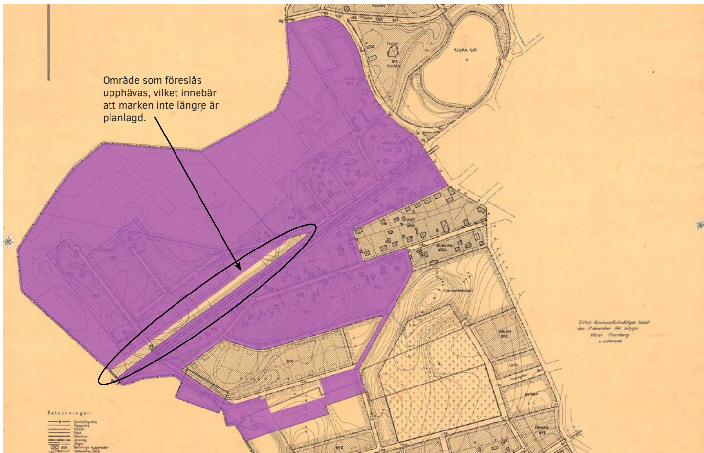
Utdrag ur den gällande planen från 1942 där området som föreslås att upphävas är undantaget.