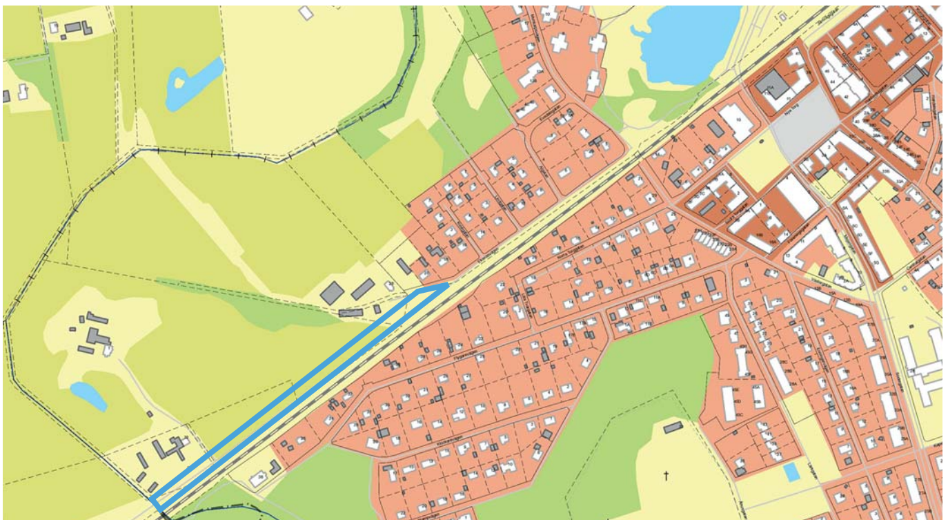
Planområdets lokalisering och ungefärliga avgränsning (blå linje).

Anledningen till upphävande är att genom att ta bort planregleringen av marken för vägområdet torde vägföreningen, enligt Trafikverkets regelverk, vara berättigade till bidrag.