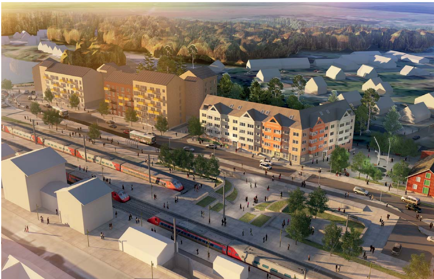
Illustrationsbild över planområdet med föreslagen ny flerbostadshusbebyggelse.