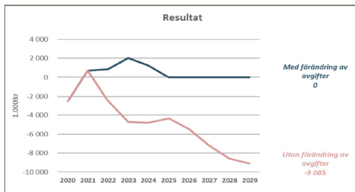
Diagram 2: Resultat per år utan höjning av bruksavgifterna och resultat per år med höjning av bruksavgifter enligt Tabell 8 nedan.