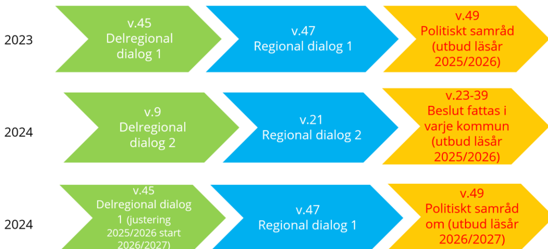
Figur 2:Tidsplan organisation 2025