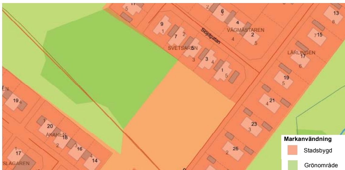
Figur 3. Utdrag från översiktsplanens markanvändningskarta

Den östra delen av det utpekade området (som idag är parkeringsyta) är stadsbygd i översiktsplanen. Den västra delen av området är utpekad som grönområde men gränsen som pekas ut i översiktsplanen är inte detaljstuderad. I stort sett är byggandet av en förskola med tillhörande förskolegård förenlig med översiktsplanen. Hästhagen är ett stort grönområde och den del som skulle tas i anspråk för den nya förskolegården är en liten del i östra utkanten av gröningens sammanlagda yta. Flera av de kvaliteter som grönområdet tillför idag, t.ex. skugga, vindsydd och visuella kvaliteter, kan komma området tillgodo även om befintlig vegetation hamnar inom förskoleområde (på kvatersmark). Översiktsplanen föreskriver att nya förskolor byggas med sex till åtta avdelningar vilket kräver tillräcklig yta.