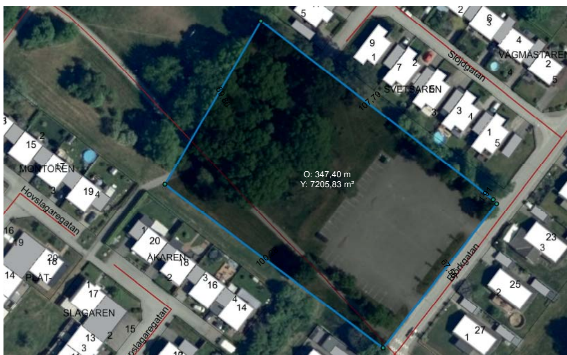
Figur 1. Möjlig avgränsning av planrområdet för ny förskola vid Björkgatan/Hästhagen

Östra Höör och teknikerområdet är en av de stadsdelar i Höör som har hög andel barnfamiljer och stort behov av nya förskolor. På kommunens mark väster om Björkgatan i anslutning till Hästhagens grönområde finns en parkerings- och grönyta som skulle vara lämplig för byggande av en ny förskola. Området korsas idag av cykelbanan från Höors centrum och vidare ut mot Sätofta hed. Cykelbanan följer ett grönstråk som binder samman Sätofta hed med den planskilda cykelkorsningen vid väg 23. Det aktuella området består av en parkeringsyta i öster och en större trädunge med flerskiktad vegetation med stora ekar i trädskiktet. I övrigt består området mest av öppna gräsytor och angränsar till det större grönområdet Hästhagen.