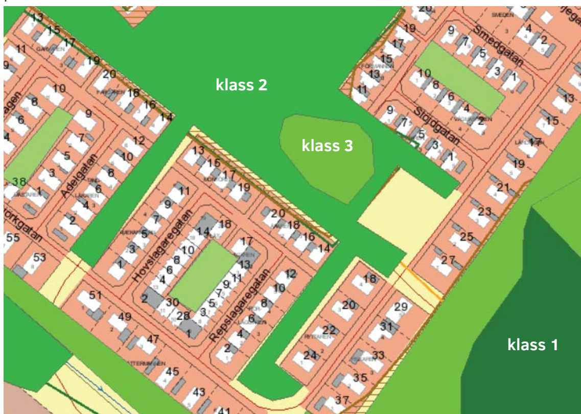
Figur 4. Utdrag som visar klassningen av grönområden enligt kommunens grönstrukturprogram från 2007

Grönområdet är inventerat och klassat i kommunens grönstrukturprogram från 2007. Den stora öppna sammanhängande grönytan Hästhagen har fått klass Klass 2 enligt programmet och ekdungen som ligger i anslutning till parkeringen har fått klass 3. I dungen finns ett flertal större ekar som i störta möjliga utsträckning bör beaktas och bevaras i samband med planarbetet.