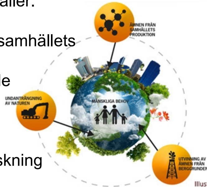
Illustration: Ledarnas Chefsguide på www.ledarna.se

4... hälsa, inflytande, kompetens, opartiskhet och mening